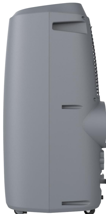
Abluftschlauchanschluss 150 mm Schlauchdurchmesser